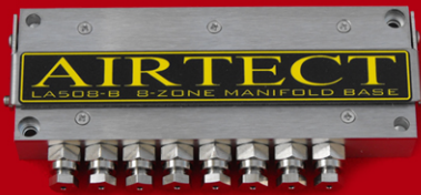
LA508-B (8-Zone Base Unit)