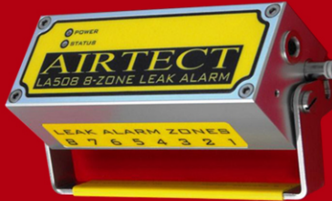
LA508-M (8-Zone Manifold Unit)